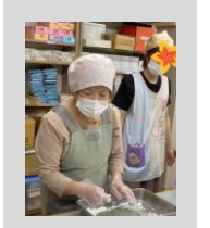
地区のスケットさん！ ありがとうございます。