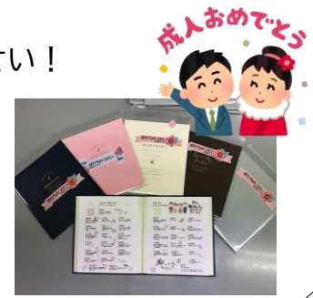
スケットさんの手を借りて素敵なメッセージアルバムができました →

東安居地区 (R3. 1. 1 現在) 6,803人 男 3,349人 女 3,454人 2,982世帯