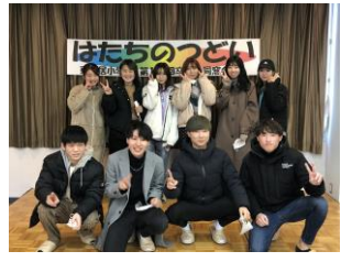
←「つどい」は中止になりましたが「しゃべり場」に10名の新成人が集まりました